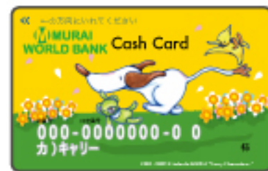
キャッシュカードデザイン案