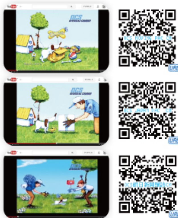
2007年:OCS アメリカローカルCMにキャリーが登場し、放映されてました。