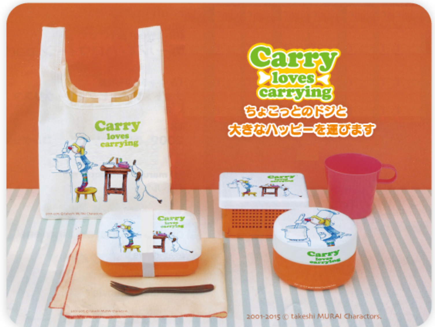
Goods image (ニューデザイン、グッズ続々)