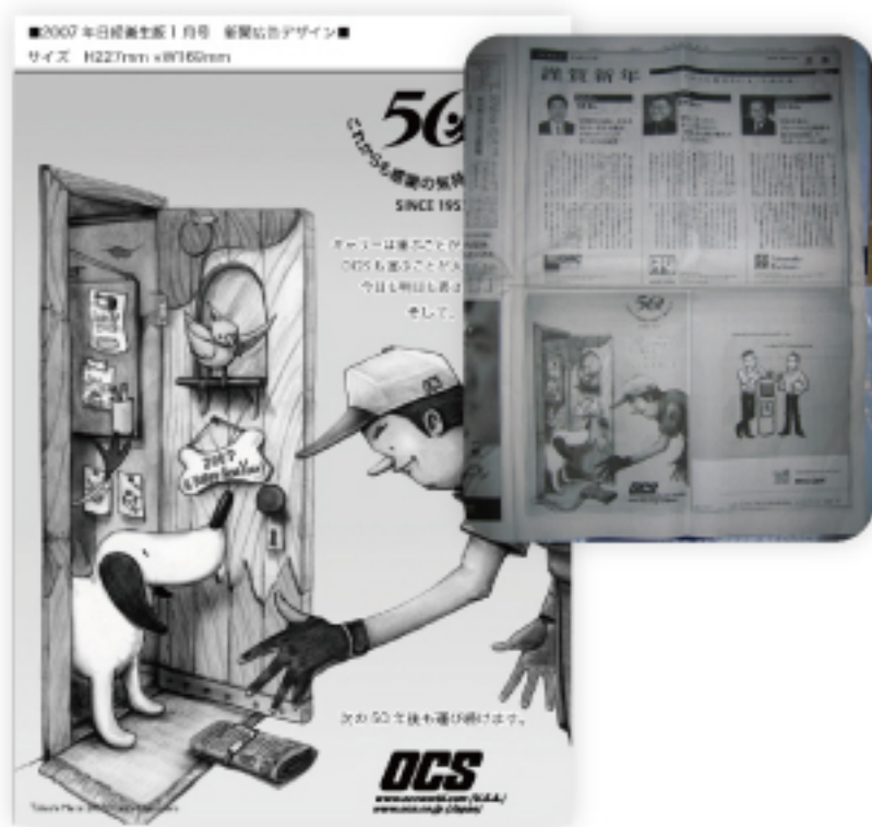
2007年:OCSの新年挨拶広告:日本経済新聞に掲載されました。