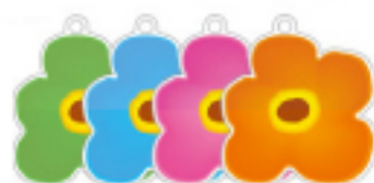
裏面カラーは4色あります。(お選びいただけません)