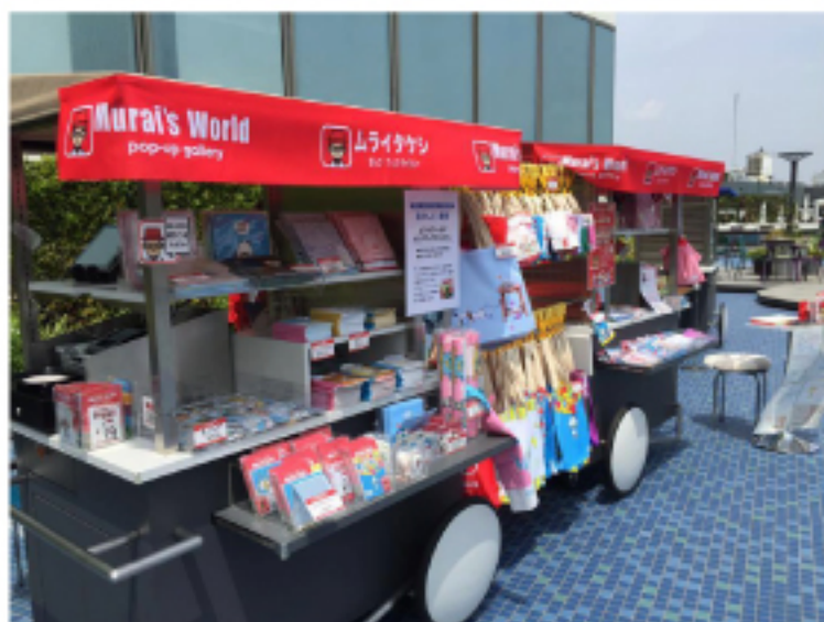
西武池袋本店屋上庭園でGWイベントに販促も 含めてムライワールドが採用されました。

株式会社トイカードさんとバブールが コラボして2月より全国で無料配布をして 妊婦さんの応援をしています