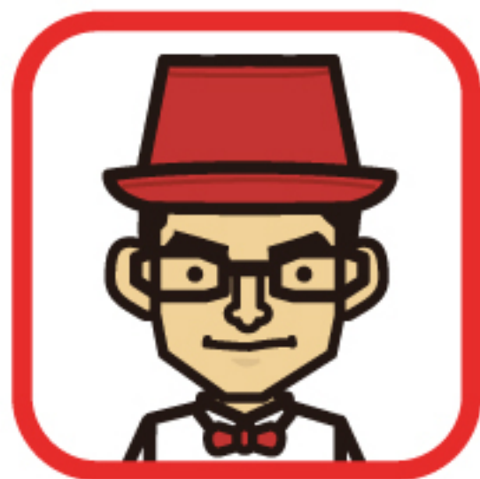
原作者 ムライ タケシ