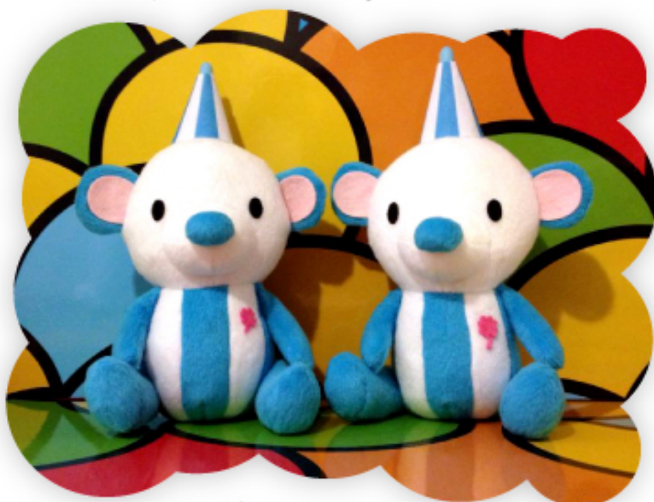
ミミーぬいぐるみ