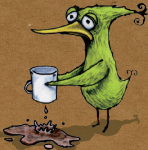
"A coffee cup and wordplay" by Takeshi Murai